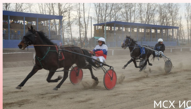
Конные соревнования на призы Губернатора Иркутской области 9 октября 2021г.